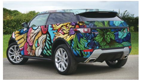
Envoltura de vehículos