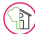
OUTDOOR / INDOOR