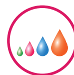
PIEZO VARIABLE DROP