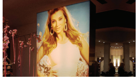
Rotulación textil / carteles textiles