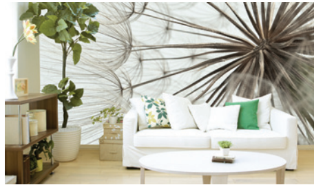
Papel de pared