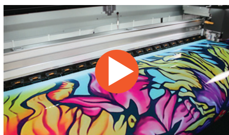
Visite Mutoh Europe en YouTube