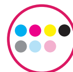
CMYK + Lk Lc Lm